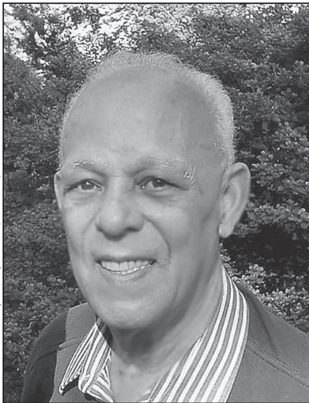
28 septembre 2002, Mount Vernon, New York